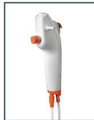
L'impugnatura ergonomica e leggera è progettata per fornire una presa salda e comoda