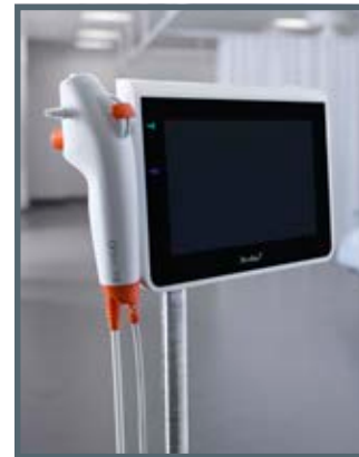
Ambu® aScope™ 4 Broncho Large e Ambu® aView™