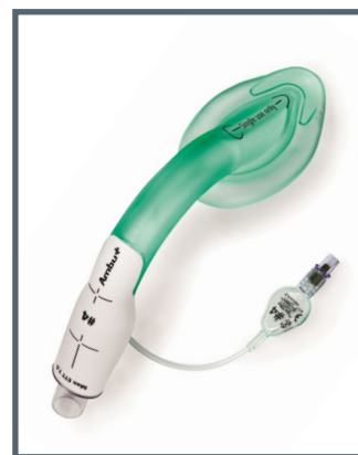
Informazioni utili sulla maschera e sul palloncino pilota