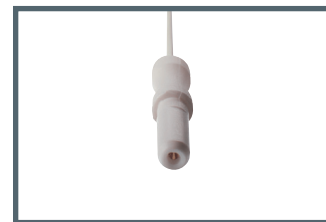
K = connessione 1.5 mm