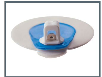
F = innesto a banana 3 mm