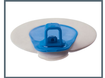
A = innesto a banana 4 mm